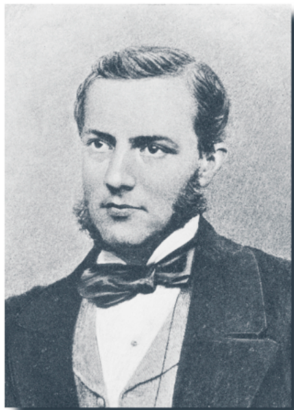
F. Max Müller

zember des gleichen Jahres ein Konvent in Oxford abgehalten, an dem viele Mitglieder des evangelischen Landesklerus, deren Unterstützung notwendig war, teilnahmen, um ihre Wahl zu treffen. Der andere Kandidat, Monier-Williams, wurde mit einem Stimmenvorsprung von 223 aus der Gesamtheit von 1433 Stimmen gewählt. Die Ansichten von Müller wurden als zu liberal angesehen, und von Monier-Williams wurde erwartet, dass er die Geistlichkeit bei ihrer evangelisierenden Vorgehensweise unterstützen würde. Wie auch immer, im Oktober 1868 wurde ein neuer Lehrstuhl für Vergleichende Philologie in Oxford gegründet mit Max Müller als erstem Inhaber.