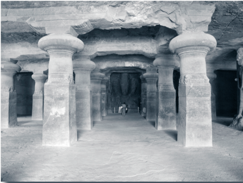
Haupthöhle mit Trimurti im Hintergrund, Elephanta, Indien

Die alten Hindulehren beziehen sich auf verschiedene Zeitalter, in denen die Menschheit lebte, und die Zyklen, die sie verwenden, sind von enormer Länge und gestehen der Menschheit ein hohes Alter zu. Das Krita-Yuga oder das goldene Zeitalter umfasst 1 728 000 Jahre, gefolgt vom Tretā-Yuga mit 1 296 000 Jahren, dann dem Dvāpara-Yuga mit 864 000 Jahren und schließlich dem Kali-Yuga mit 432 000 Jahren. Gemäß ihrer Chronologie sind ungefähr 5 100 Jahre des Kali-Yuga abgelaufen, und deshalb begann das goldene Zeitalter vor rund 3,8 Millionen Jahren. In all diesen Yugas lebten Menschen und königliche Dynastien, von denen einige ihre Spuren hinterlassen haben müssen. Die großen Weisen, Initiatoren oder Gott-Könige werden vor allem den ältesten Yugas zugeordnet. Wie dem auch sei, „in den modernen Akademien haben nur wenige den Drang verspürt, in ‘den indischen Mythen’ ernstlich nach Wahrheit zu suchen. Folglich regiert die Geschichte des vedischen Indiens weiterhin als das größte Rätsel von Mythos versus Tatsache“. 1