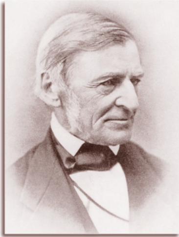
Ralph Waldo Emerson

Böse ist bloß verneinend, nicht absolut ... Alles Böse ist so sehr Tod oder Nicht-Wesenheit“. Er unterwirft sich der Tugend und ruft aus: „Tugend, ich bin dein; errette mich; benütze mich; dir will ich dienen Tag und Nacht, im Großen, im Kleinen, damit ich nicht nur tugendhaft bin, sondern die Tugend selbst; – dann ist das Ziel der Schöpfung beantwortet und Gott ist erfreut.“ Whitman jedoch lehnte jeden Versuch ab, zwischen verschiedenen Erfahrungen – gut oder böse – zu unterscheiden und sagte: