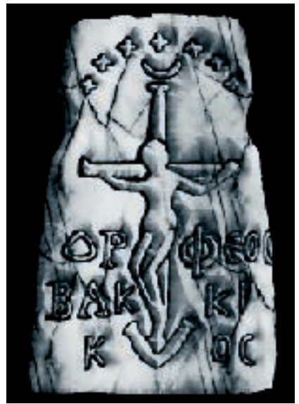
Die Reproduktion beruht auf einem orphischen Siegel, 3. Jh. n. Chr.

Bei der Synthese des immerwährenden Mythos des sterbenden und auferstehenden Gottmenschen in der jüdischen Erwartung eines historischen Messias machten die Erschaffer der jüdischen Mysterien einen noch nie dagewesenen Schritt, dessen Folge sie niemals vermutet haben würden. Und doch war, wenn