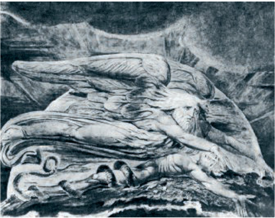
Blake, „ Creation of Adam “

rein materiellen Geschöpfen, die bloß als Rädchen im Getriebe von Maschinen funktionieren. Die Namen des englischen Wissenschaftlers Newton und des Philosophen Locke vertreten in seiner Dichtung die vernunftbegabten Elemente in der menschlichen Natur. Sie symbolisieren die übermäßigen Abhängigkeit vom mechanischen Teil des Denkvermögens – jenes Teils von ihm, der nur den ‘Computer’ oder das Gehirn antreibt und nicht das höhere Element, das es programmiert. Blakes Standpunkt ist, dass das auf Kosten der edleren Eigenschaften des Menschen erfolgt. Der Schöpfer der physischen Welt, der ‘Arbeiter’, könnte nur ein maschinenähnliches Universum herstellen, das wirklich nur ein Schattenbild des weit erhabeneren Reiches darstellt, in dem den wahrhaft schöpferischen Aspekten des Göttlichen ein größerer Spielraum gewährt wird.