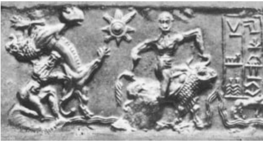
Gilgamesch und Enkidu (man beachte das affenähnliche Gesicht Enkidus in dieser ungewöhnlichen Darstellung). Zylindersiegel aus Ur, 3. Jahrtausend v. Chr., Höhe 1,5 Zoll.

verschlingen. Anu kapitulierte und reichte Ishtar die Zügel des Stieres und sie trieb ihn unmittelbar nach Uruk hinunter.