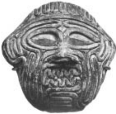
Humbaba, ~7. Jh. v. Chr. (Britisches Museum)

bewältigten sie die Distanz eines 45-Tage-Marsches. Die genaue Länge der Reise ist nicht bekannt, sie hat aber wahrscheinlich sechs Tage gedauert, jede Nacht wurde ein Berg (oder ein Gebirgszug) überquert, bevor sie bei dem siebenten ankamen: dem Zedern-Berg. Nach jeder Tagesreise gruben sie vor Sonnenuntergang einen Brunnen, dann erstieg Gilgamesch einen Berg, um ein Traumgesicht zu erlangen, eine günstige Botschaft von Shamash.