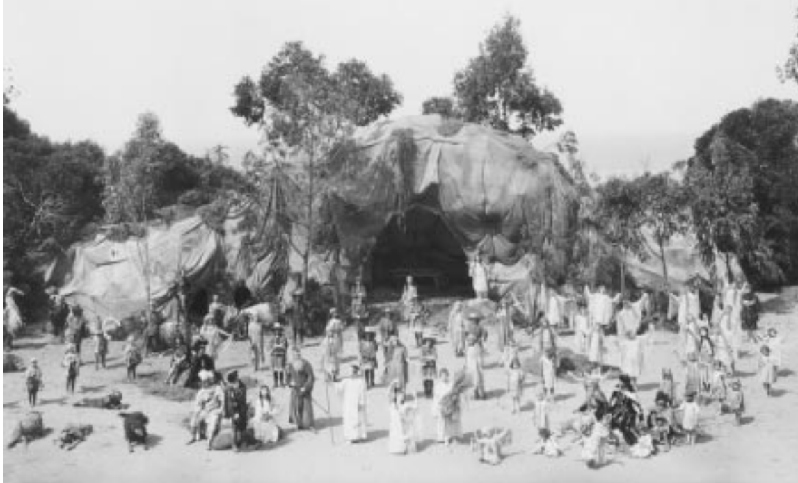
Shakespeare, Der Sturm , inszeniert von Katherine Tingley, Griechisches Theater, Point Loma, Kalifornien, 1926.

Kern seines Wesens eingeschlossen sind. Dieser Vorgang wurde als eine Art Verfeinerung der Qualität betrachtet, als ein Entfernen der selbstsüchtigen Verkrustungen, was zur allmählichen Enthüllung der Spiritualität führte; so stellte der Mensch mit der Zeit bewusst seinen göttlichen Rang dar.