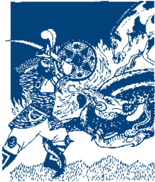
Rustem tötet den Drachen.

Als Folge dieses Ausgleichs muss der Held Versöhnung mit der Vaterfigur erlangen. In der Mythologie wird der Schatz immer von einem Drachen oder einem Monster bewacht, das größer und mächtiger ist als jeder Widersacher, und die vorangegangenen Prüfungen haben den Helden auf diese letzte Begegnung vorbereitet, denn ohne die zuvor an den Tag gelegte Furchtlosigkeit – die