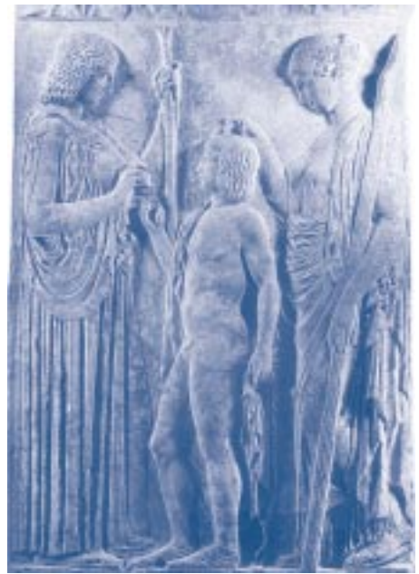
Demeter und Persephone mit Triptolemos. Eleusinische Mysterien, 5. Jh. v. Chr.

... die böchsten Planetengeister ... erscheinen auf der Erde nur am Beginn jeder neuen menschlichen Art; bei der Verbindung und beim Anschluss der zwei Enden des großen Zyklus. Und sie verweilen nicht länger bei den Menschen als die Zeitspanne, die erforderlich ist, um die ewigen Wahrheiten, die sie lehren, dem plastischen Verstand der neuen Rassen so wirksam einzuprägen, dass Gewähr dafür gegeben ist, dass sie in den folgenden Zeitaltern von den kommenden Generationen nicht verloren oder ganz vergessen werden. Die Aufgabe des Planetengeistes besteht lediglich darin, den GRUNDTON DER WAHRHEIT anzuschlagen.