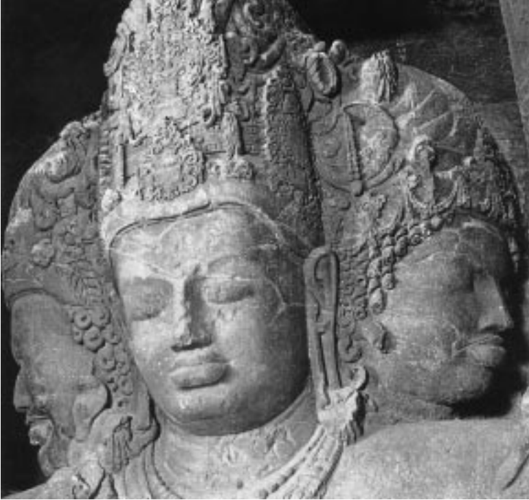
Hindu Trimūrti (Brahmā, Viṣṇu, Śiva)

die ungeteilte oder undifferenzierte Ursache erwähnt: „Nach der letzten Auflösung und vor der Schöpfung des Universums waren alle Dinge in jenes Prinzip eingehüllt.“ Es hat keinen Ton, kann nicht berührt werden und hat keine anderen Aspekte, die sich erst später manifestieren. Ursprünglich „gab es weder Tag noch Nacht, noch Himmel noch Erde, noch Dunkelheit noch Licht, noch irgendwelche andere Dinge, ausgenommen das Eine, unfassbar für den Verstand, oder Jenes, das Brahma und Pums (Geist) und Pradhāna (Materie) ist“ (1:21-4). Dann ist die höchste Seele