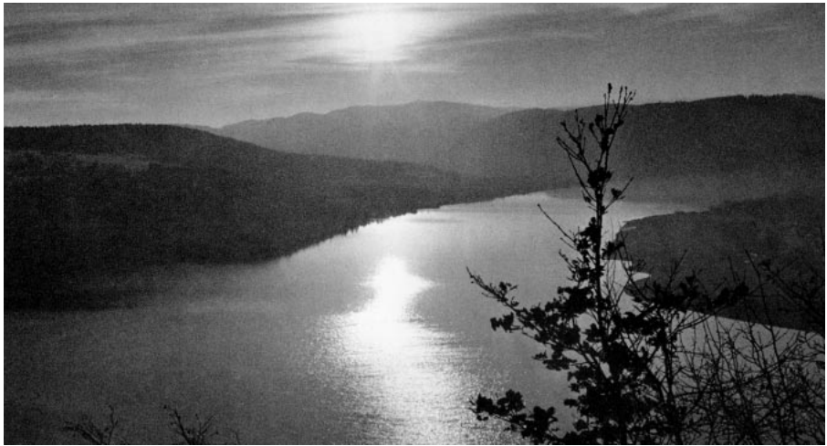
Die Vltava, südlich von Prag.

So wie die Menschen mit ihren Streitigkeiten einst zu Krok gegangen waren, so kamen sie nun zu Libussa, die gerechte Urteile fällt. Eines Tages geschah es, dass zwei Stammesälteste über den schmalen neutralen Rain oder Balk zwischen den Feldern in Streit gerieten und jeder beanspruchte ihn für sich. Sie eilten zum Vyšehrad, wo die Prinzessin mit zwölf alten und mächtigen Männern an ihrer Seite Gericht hielt. Zusätzlich hatte sich dort eine große Menschenmenge versammelt. Die zwei Streitenden standen vor ihr, der jüngere beschuldigte den älteren. Dieser jedoch, mit vollem Bart und grimmig, forderte, dass sein Wille geschehen sollte, ohne die sich daraus ergebende Ungerechtigkeit zu bedenken.