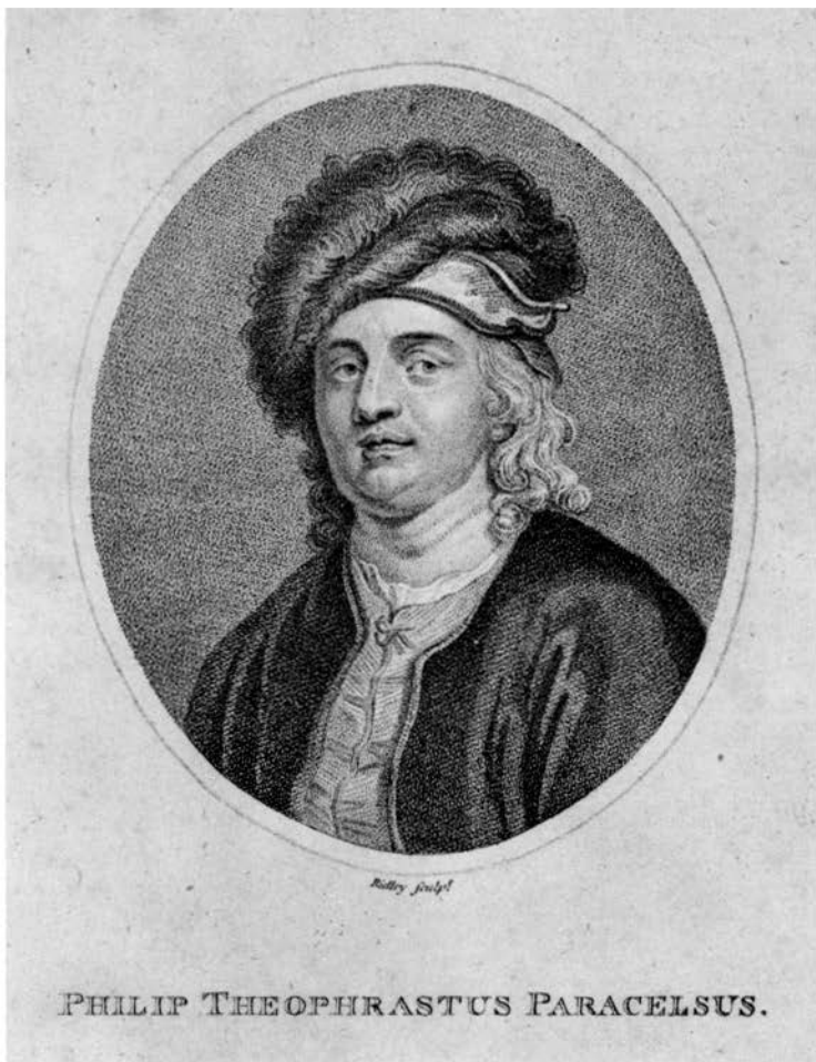
PHILIP THEOPHRASTUS PARACELSUS.