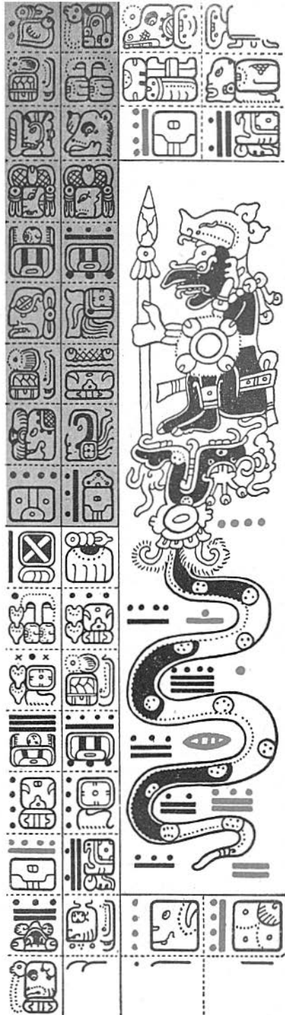
Maya Hieroglyphen aus dem "Dresdner Codex"

Da ist noch mehr. Auf dem amerikanischen Kontinent fand man bislang 15 verschiedene Zivilisationen. Eine davon, die Maya Zivilisation baute über 4000 Tempelstädte aus Stein, eine andere in Peru baute eine gepflasterte Straße 8 m breit und in einer Länge von 6500 km über Berge hinweg, über Flüsse und durch Wüsten mit Tunnels und Hängebrücken, Meilensteine, Rasthäusern und Posten, welche die Teile eines Reiches zusammenhielten, das größer als Europa mit Ausschluß von Deutschland und Rußland war. Zu der Zeit der Eroberung umfaßte der Aztekische Bund 10 - 15 Millionen Menschen verschiedener Volksstämme und Sprachen. Groß Mexiko City muß eine Million Einwohner gehabt haben. — Zu der-