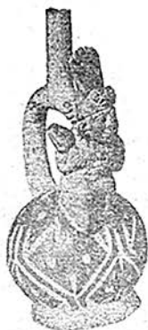
Krug mit steig- bügelförmigem Ausguß Mochica Kultur

Diese Theorie ist nicht so weit hergeholt, wie es klingen mag, wenn wir an die vielen ähnlichen Monumente denken, die in der alten Welt reichlich vorhanden sind und wer weiß von welchem Volke der Vergangenheit zurückgelassen wurden, wie zum Beispiel die Überreste der alten Pelasger in Italien und Griechenland, oder die der Bildhauer der gewaltigen Statuen von Bamian, von denen eine 173 Fuß hoch ist und die noch existieren, wenn auch von den Horden Genghis Khans schwer beschädigt. Hsüan Tsang beschreibt sie im siebenten Jahrhundert als mit Gold überzogen. Ob sich die Größe der Menschen mit der Zeit änderte ist eine Frage, über die große Meinungsverschiedenheit herrscht. Manche der ältesten menschlichen Überreste scheinen jedoch die jeder Religion eigenen Mythen und Traditionen zu rechtfertigen, daß es, wie die Bibel sagt, "in jenen Tagen auf Erden Riesen gab".